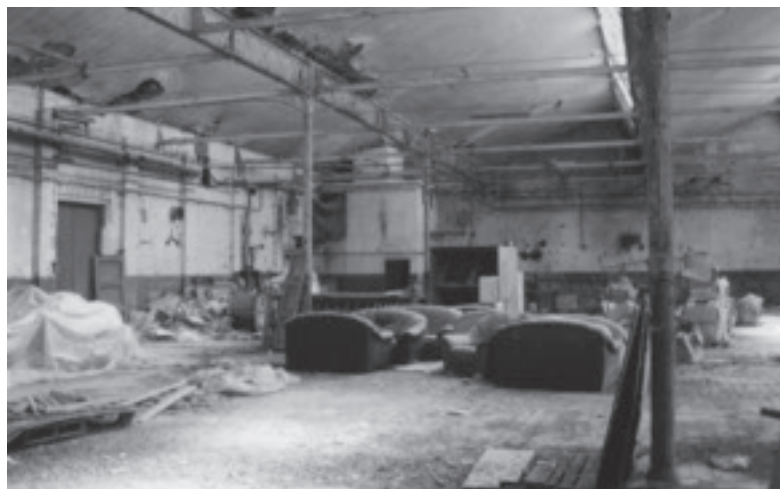
Sous les nefs de la Manufacture Française de Tapis et Couvertures en 1997.

Or, Mouscron, c'est le textile. Après un itinéraire de plus de deux siècles et demi, cette activité a fait d'un village paysan une cité industrielle 1 , située dans une région où cette branche de l'industrie a été durement touchée par des transformations radicales qu'elle a connues en Europe dans le dernier quart du XX e siècle 2 . Témoins d'un pan non négligeable de l'histoire de l'industrie textile en Belgique – une histoire encore largement méconnue, sauf exceptions 3 –, nombre de sites industriels mouscronnois ont réussi à se maintenir jusqu'à présent. Les disparitions totales ont été assez peu nombreuses.