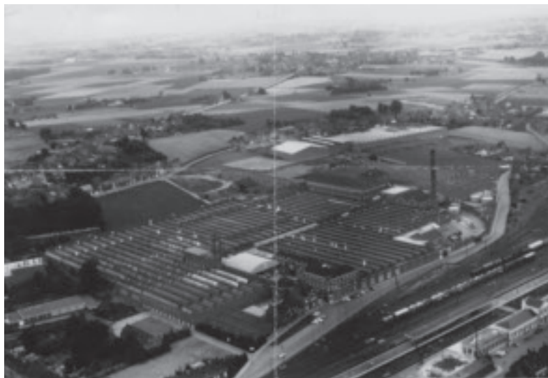
Au temps de sa plus grande extension (1960-1980), la filature Motte & Cie face à la gare de Mouscron

La démolition volontaire a touché cinq usines tandis que les incendies – dont on peut se demander si certains d'entre eux ne furent pas volontaires – ont ravagé trois sites, soit presque un