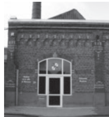
L'entrée des Archives de la Ville de Mouscron depuis 2001 dans les anciens bâtiments rénovés de la Manufacture Française de Tapis et Couvertures

On y trouve un peu d'habitat, plus souvent des locaux techniques à l'usage de l'administration locale. Après une réhabilitation précédant la mise en location ou suivant la mise en vente, ces lieux voient s'installer de nouvelles entreprises, mais non textiles celles-là. Quels qu'ils soient, ces travaux d'adaptation