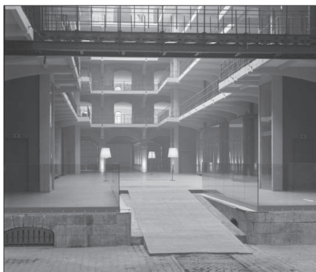
Fig. 13 - L'Entrepôt royal (Site internet consacré à Tour & Taxis).

A voir à La Fonderie. Musée bruxellois de l'industrie et du travail , du 25 juin au 21 novembre 2004 27, rue de Ransfort 1080 Bruxelles Renseignements et réservations : 02/410.99.50