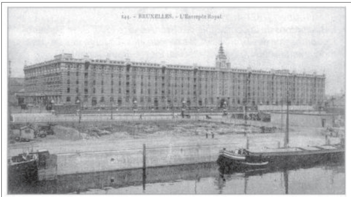
Fig. 12 - L'Entrepôt royal.

tique exceptionnelle de ce vaste ensemble qu'il importait de préserver.