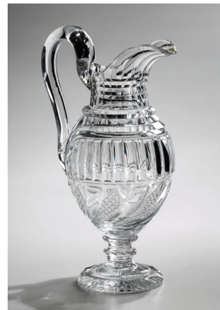
Cruche à anse élevée ronde sur pied H. 32 cm. Inv. n° 578.