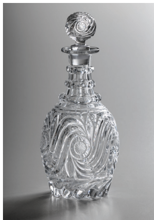
Carafe à trois cordons H. tot. 30 cm. Inv n° 270 a-b.