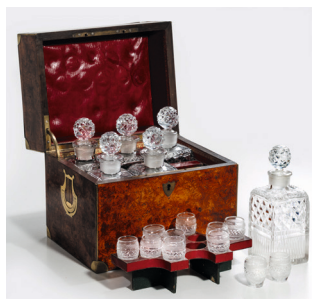
Cave à liqueur avec six carafes et dix verres de type baril H. x L. x P. 24,3 x 27,3 x 21,2 cm. Inv. n° 750.