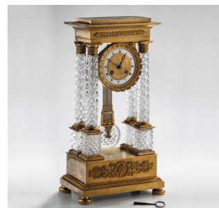
Horloge à colonnes H. 42 cm ; L. x P. 22,5 x 14,2 cm. Inv. n° 753.