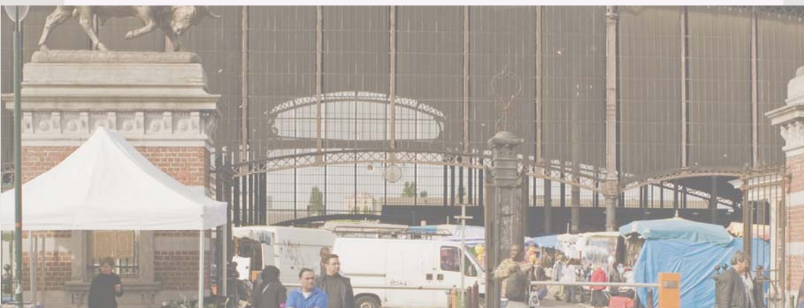
Abattoirs et marché d'Anderlecht