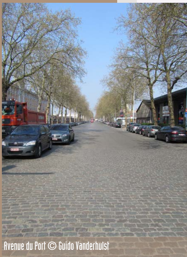
Avenue du Port

Depuis 3 ans, l'asbl BruxellesFabriques attire l'attention de la Région de Bruxelles-Capitale sur la valeur patrimoniale de l'avenue du Port, sans doute la dernière du pays de caractère industriel. D'autres associations et comités de quartier (maritime, Marie-Christine/Reine/Stéphanie), Inter-Environnement Bruxelles et l'ARAU contestent, pour leur part, le gaspillage d'argent et l'énorme empreinte écologique que serait la réalisation d'une autoroute urbaine absolument inutile. Sans parler de la perte du superbe double alignement de platanes.