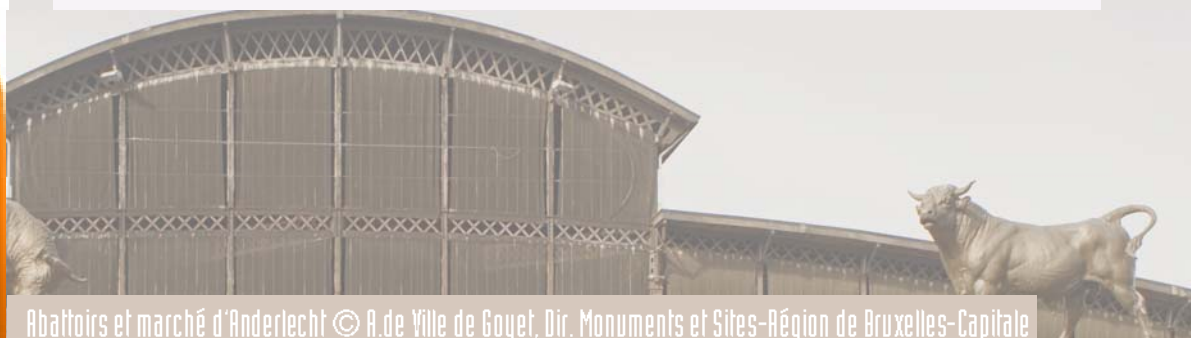
Abattoirs et marché d'Anderlecht