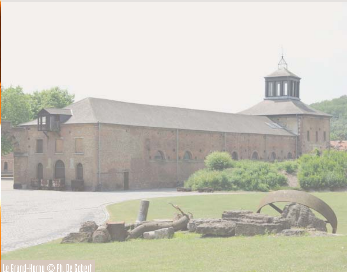
Le Grand-Hornu

Jusqu'au 30 septembre : exposition sur les D'KARBIDSLUUT Made in Luxembourg (Newsletter N°24 - PIWB www.patrimoineindustriel.be )