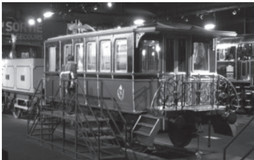
Vue d'ensemble (ci-dessus) et détail extérieur (ci-dessous) de la voiture-salon impériale « N°6 PO », construite en 1856, sous Napoléon III.

Ci-dessous : une Voiture salon-restaurant de type « Pullman » créée par la Compagnie Internationale des Wagons-Lits à partir de 1926.