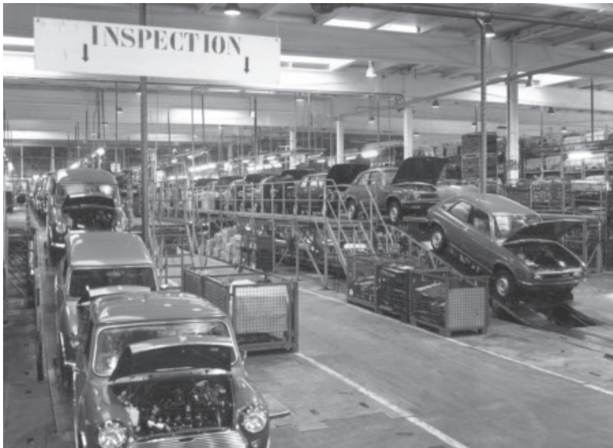
Ci-dessus : Ecomusée régional du Centre, fonds Leyland, vue intérieure de l'usine : chaîne de montage.