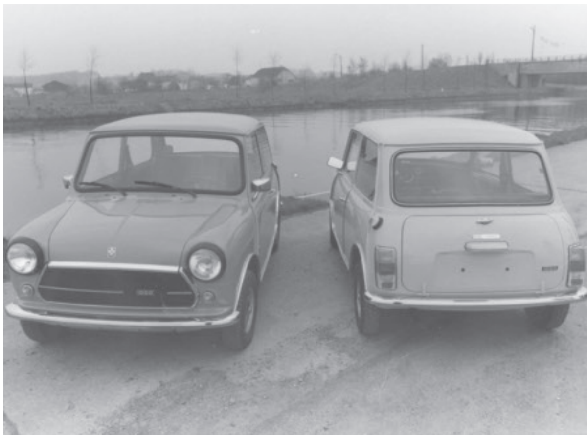
Ci-dessous : Ecomusée régional du Centre, fonds Leyland, deux voiture « Mini » produites à Seneffé.