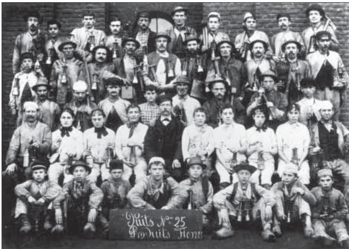
Fig. – 7. Personnel du Puits 25 au charbonnage des Produits, à Flénu vers 1890.