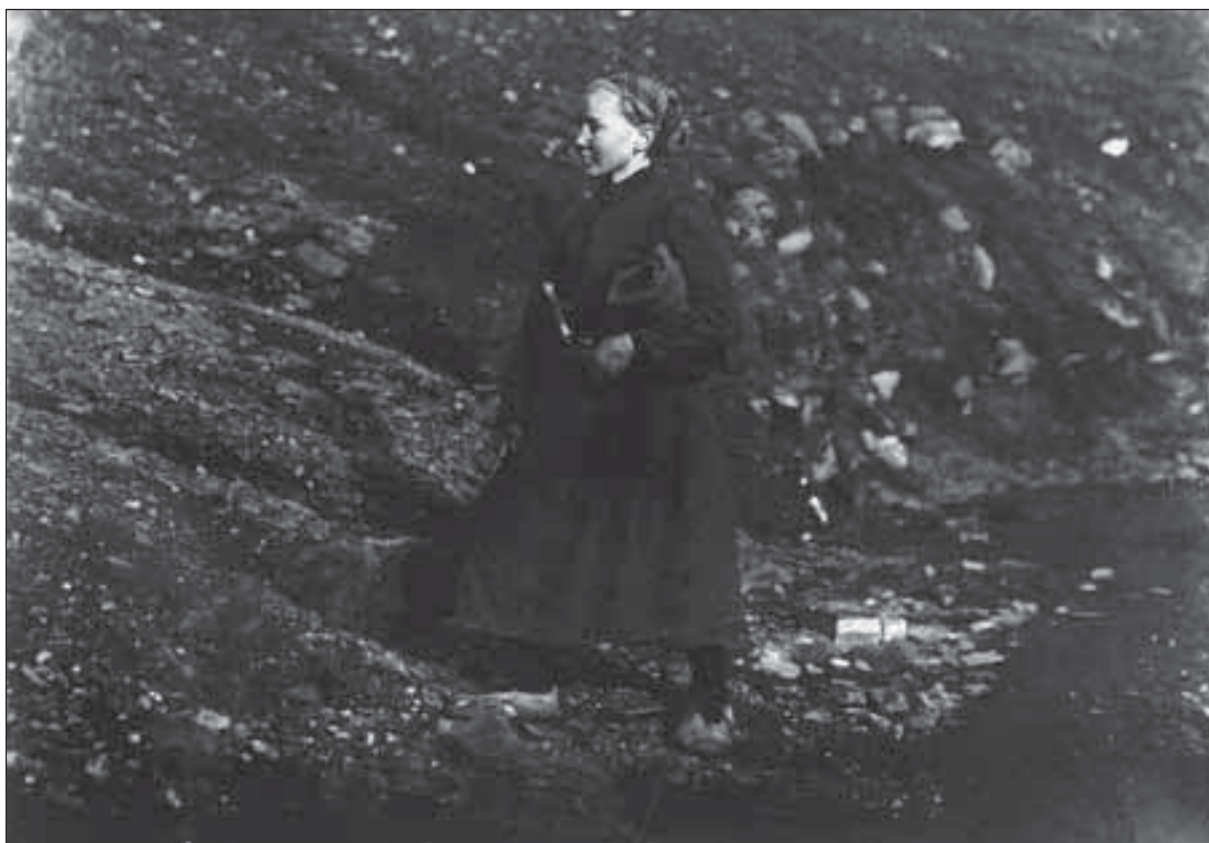
Fig. – 6. Femme au pied d'un terril dans le Borinage (sans date).