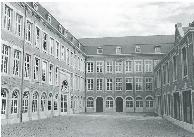
6. Bâtiment néo-classique rénové du Centre touristique de la Laine et de la Mode de Verviers.

Renseignements pratiques : Centre touristique de la Laine et de la Mode rue de la Chapelle 30, 4800 VERVIERS Tél. : 087/35.57.03 Fax : 087/31.20.95