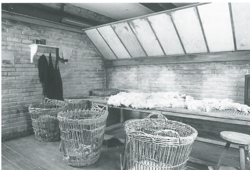
7. Parcours-spectacle : le triage de la laine.